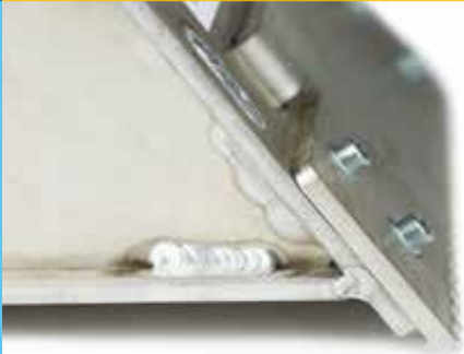
Griffe d'ancrage au sol